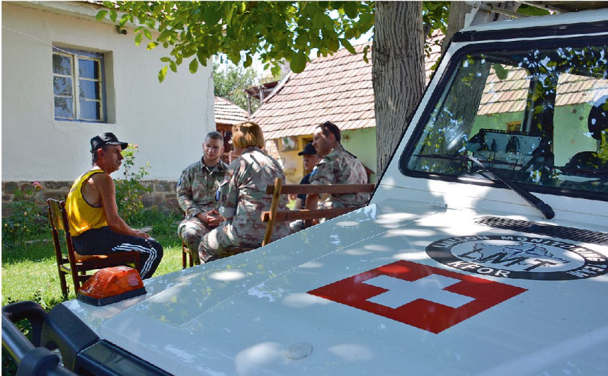
Angehörige eines Liaison and Monitoring Teams (LMT) im Gespräch mit der Bevölkerung.

der Maximalbestand von gegenwärtig 220 auf 235 Armeeinghörige angehoben werden. Mit der Aufstockung von 15 Personen kann die Funktion des Kommandanten des Joint Regional Detachment North (JRD-North) ins normale Kontin-