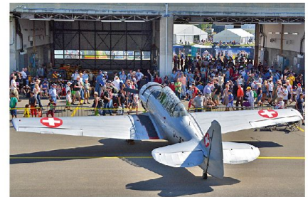
Wenn die raren Stücke nicht flogen, waren sie zumindest Teil einer einzigartigen Ausstellung.

symbolisiert in den Manövern die legendäre Präzision, die in vielen Schweizer High-Tech-Produkten steckt. Die rot/weiße Bemalung stellt eine direkte Verbindung zu der Flagge und damit dem Logo der Schweiz her, welches ja auf allen Schweizer Gütern und der Webseite des Tourismusbüros dominiert. Schweizer Ar-