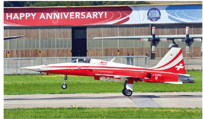
Hoffentlich erleben wir noch viele Landungen der Patrouille Suisse!

gern und -helikoptern war erstaunlich. Natürlich mit einem Schwergewicht auf Europa, was für mich, aus den USA kommend, eine weitere erfrischende Besonderheit war. Dennoch, mein Interesse galt mehr den Flugzeugen der Schweizer Armee, einige von denen hatte ich noch nie live erlebt. Andere habe ich schon seit Jahrzehnten nicht mehr gesehen und war froh, sie diesmal mit einer guten Kamera in der Hand aufnehmen zu können (als Soldaten hatten wir damals kaum je eine Kamera dabei, was im Nachhinein sehr bedauerlich ist). Speziell die mittlerweile schon legendären Vampire, Mirage und Hunter, die damals die Stars von Dokumentarfilmen wie «Ordine Attaco» waren; Bambini Code des Kalten Krieges inklusive.