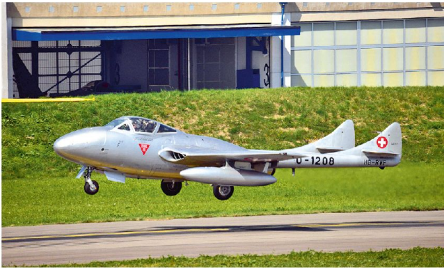
Eine neue «zivile» Verwendung für den Vampire.