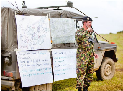
Die Armee muss ihre Fähigkeiten und Kernkompetenzen erhalten und verbessern. Dies gelingt nur durch gezieltes Üben.

Armee auf angeblich wahrscheinlichere Aufgaben eines nationalen Verbundes der Friedens-, Existenz- und Raumsicherung. Der gefährlichste Fall einer klassisch militärischen Verteidigung muss aber auch heute noch den Kern der Aufgabe unserer Streitkräfte bilden. Kann sie diesem Fall