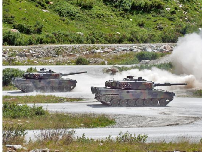
Auch im 21. Jahrhundert muss die Armee die klassischen Verteidigungs-Kompetenzen aufrechterhalten.

hen? Niemand! Daher hätten auch 2014 Regierungen allen Grund, sicherheitspolitisch Vorsicht walten zu lassen und die Militär- und Rüstungspolitik nicht einfach den Opportunitäten naiver zeitgenössischer Strömungen unterzuordnen.