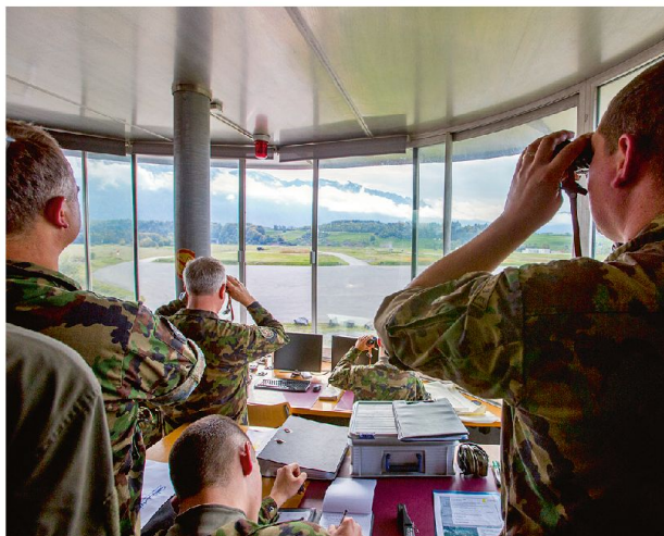
Die Sicherheitspolitik muss mit Weitsicht betrieben werden und allen Eventualitäten gerecht werden.

Diese Konflikte haben das Potential, die globale Sicherheit zu destabilisieren, etwa infolge eines Einsatzes taktischer Massenvernichtungswaffen durch Islamisten. Vor diesem Hintergrund bergen die stark sinkenden Verteidigungsbudgets