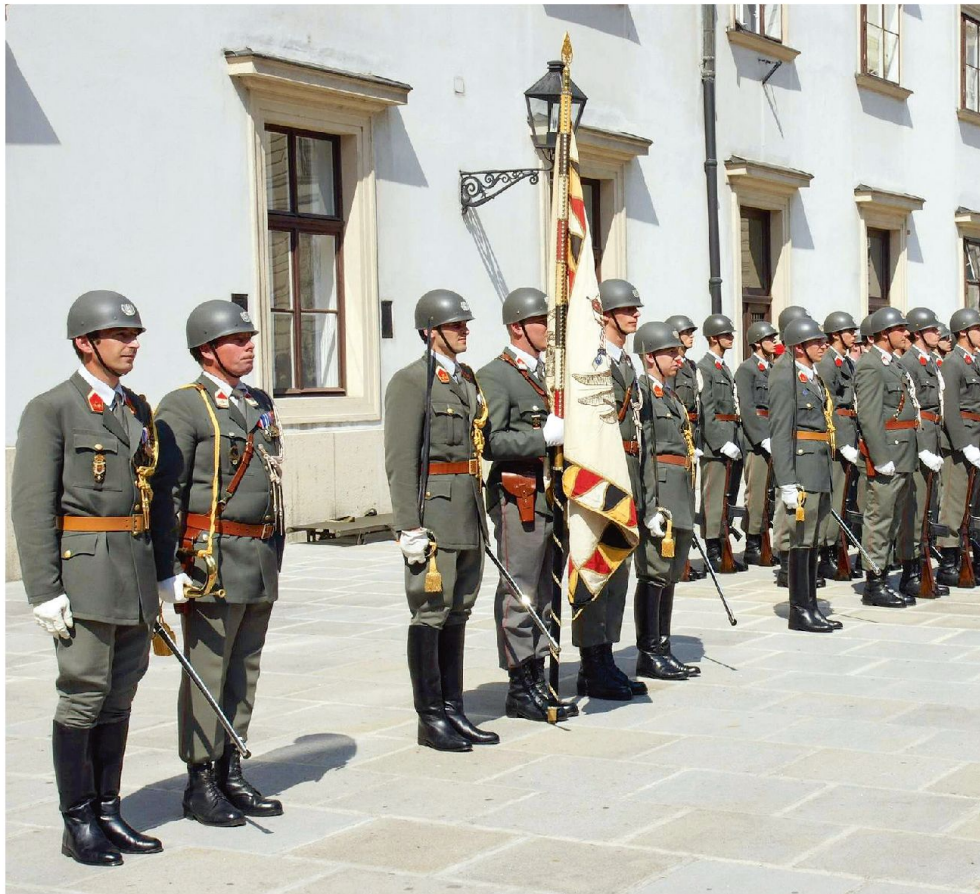
Garde in der Wiener Hofburg.

Wie sonst soll es zu erklären sein, dass das österreichische Heer nunmehr am Boden liegt. 70 Prozent des Wehrbudgets, das ohnedies auf ein Mass von 0,6 Prozent des BIP gesunken ist, gehen für Personalkosten auf. Für 16 200 Berufssoldaten und 8000 Zivilbedienstete, die den Rahmen eines Heeres stellen, das alles andere als «nach den Grundsätzen eines Milizsystems» organisiert ist. Auf dem Papier wird die Heeresstärke mit 55 000 Soldaten angegeben. In dieser Zahl sind neben dem Berufskader auch die jährlich für sechs Monate einrückenden Wehrpflichtigen (also Rekrutenschüler, Anm.) eingerechnet. Um der Papierform zahlenmässig gerecht zu werden, zählt man dazu zehn leichte Milizbataillone, von denen kein einziges personell und materiell einsatzbereit ist. Gedanken an die einstigen Dörfer des Grafen Potemkin drängen sich da