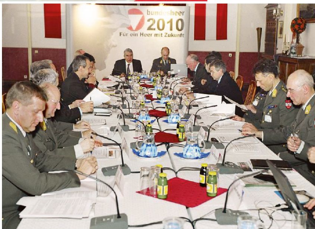
Reformkommissionssitzung –Präsidiumssitzung: Für ein Bundesheer mit Zukunft?

fi-Truppe von 15 000 Mann. Auch diese Bereitschaftstruppe, hauptsächlich in mechanisierten Verbänden organisiert, sollte aber ebenso wenig wie die Miliz zur vollen Stärke gelangen.