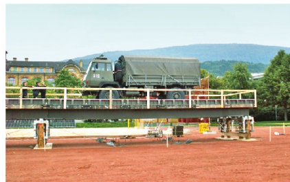
Abb.1 (oben): Rammgerät 97 auf Schwimmplattform, bereit zur Demonstration.