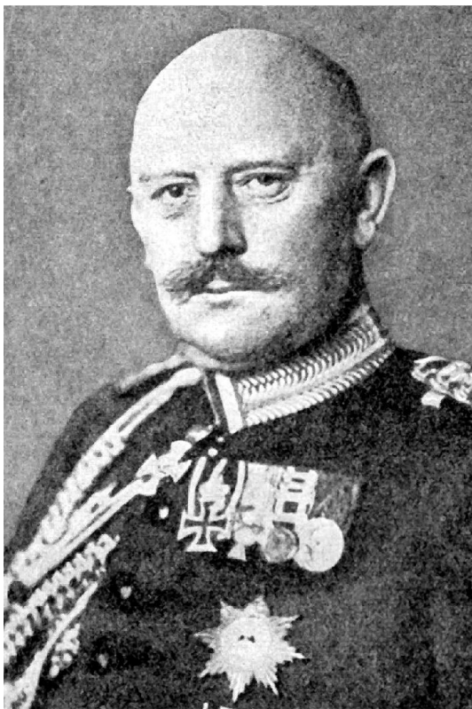
Abb. 2: General Helmuth Johannes Ludwig von Moltke («Moltke der Jüngere»).

Bereits in den 1880er Jahren befasste sich der Grosse Generalstab mit dem Problem des Krieges gegen die zwei Grossmächte Frankreich und Russland. Nach Ansicht von Alfred Graf von Schlieffen (1833–1913; 1891 bis 1906 Chef des Grossen Generalstabes), liess sich ein Zweifrontenkrieg durch Deutschland nur dann mit Aussicht auf Erfolg führen, wenn zuerst die französische Armeen in einem raschen Feldzug niedergeworfen und dann die freigewordenen Kräfte mit