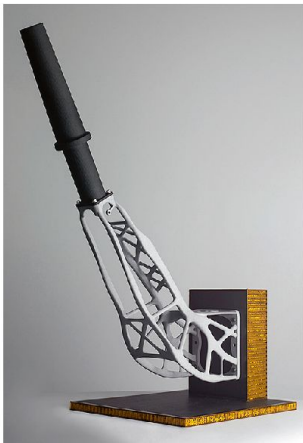
Im 3D-Druck hergestellte Antennenhalterung für einen Sentinel-1-Satelliten.

Das Schweizer Raumfahrtunternehmen RUAG Space will schon bald Satelliten mit Bauteilen ausrüsten, die aus einem 3D-Drucker kommen. Das soll Gewichts- und Kostenvorteile bringen. In einem Pilotprojekt haben die Spezialisten der RUAG Space eine Halterung für die Antenne eines Erdbeobachtungssatelliten gebaut. Eine vergleichbare,