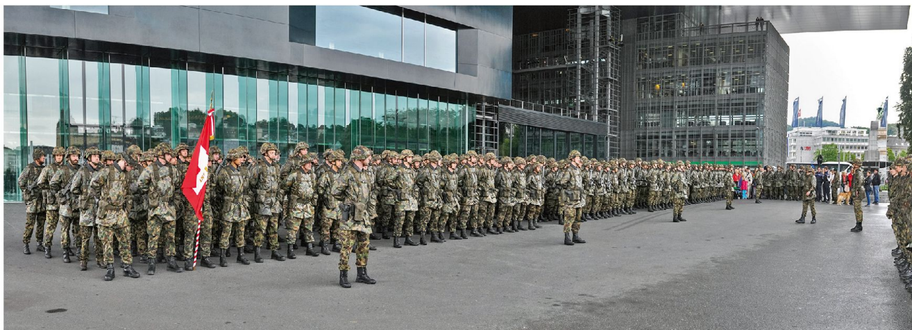
Unter dem schützenden Dach des KKL.

Die zahlreichen Zuschauer erlebten eine schöne und würdige Fahnenabgabe. Die ASMZ wünscht dem scheidenden Bat Kdt für seine militärische und zivile Zukunft alles Gute. Sch