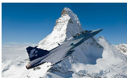
Gripen Demonstrator vor dem Matterhorn.

dernste Generation zu investieren. Andererseits besteht die Chance, die Lücken in «Erdkampf» und «Aufklärung» zumindest teilweise zu füllen. Mit dem Gripen kann der Luftpolizeidienst sofort bei der Einführung vollumfänglich in enger Anlehnung an die bestehenden Mittel (F/A-18) gewährleistet werden. Die beiden anderen Fähigkeiten müssen erst wieder neu erarbeitet werden, das wird Jahre (!) dauern. Natürlich stellt sich die Frage nach der Notwendigkeit dieser zwei «in Vergessenheit geratenen» Fähigkeiten im heutigen sicher-