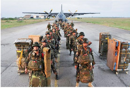
Interventionskräfte, hier Operation SERVAL in Mali.

hundert weitergehen. Bislang weiss man nur, dass weder militärische Mittel allein noch pazifistischer Verzicht auf sie Frieden sichern kann. Es ist deshalb sinnvoll, die bestehenden staatlichen und internationalen Organisationen Schritt für Schritt an die sich abzeichnenden Entwicklungen anzupassen und sie so umzugestalten, dass sie ihrer weiterhin gülti-