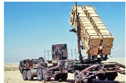
US-Raketenabwehrsystem Patriot.

Ähnliches gilt für Cyber-Defence, zumindest wenn man neben der passiven Schutzkomponente auch aktive Möglichkeiten ins Auge fassen will. Cyber-Abwehr bedeutet schon gegenüber staatlichen Akteuren in vielerlei Hinsicht Neuland zu betreten, auch in rechtlicher Hinsicht, doch noch viel mehr gilt das für das Handeln nicht-staatlicher Akteure, also die sogenannten neuen Gefahren wie Terrorismus, Piraterie und organisierte internationale Kriminalität.