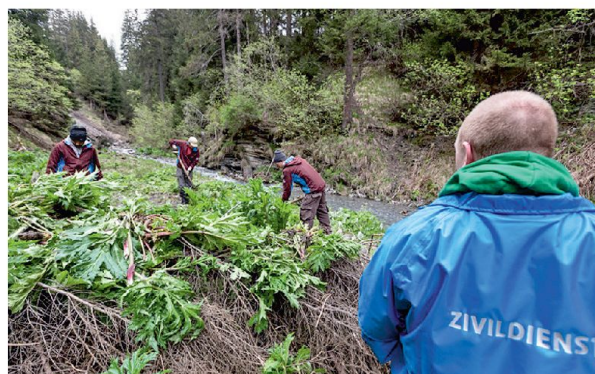
Zivildienstleistender im Einsatz.

Zivildienstler leisten einen achtbaren Dienst an der Gemeinschaft. Im Rahmen der Studie «Dienstpflicht» ist er zu überprüfen. Freiwilliger Zivildienst ist dabei