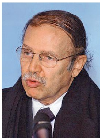
Der algerische Präsident Abd al-Aziz Bouteflika.

«Kein Notfall, lediglich ein Routinecheck» hiess es aus dem Umfeld des algerischen Präsidenten nach seinem erneuten Aufenthalt in Frankreich im Januar 2014. Schon viele afrikanische Machthaber liessen sich im Pariser Militärspital Val-de-Grâce behandeln. Doch kaum jemand kehrte so geschwächt und dem Tode nahe in sein Heimatland zurück wie Abd Al-Aziz Bouteflika letztes Jahr. Der 77-jährige Staatspräsident hatte im April nach einem Schlaganfall Genesung in Frankreich gesucht. Dabei liess er sein öl- und gasreiches Vaterland für 81 Tage in der Regierungsgewalt seines Vertreters. Ist das eine Option für die Zukunft – eine Zukunft ohne Bouteflika? Dass sich Bouteflika im April 2014 zum vierten Mal der Präsidentschaftswahl stellen wird, ist zwar noch offen, aber unwahrscheinlich. Doch wer soll in seine Fussstapfen treten? Ihm, der Ende der neunziger Jahre einen grausamen Bürgerkrieg beendete. Eine Gewaltperiode, die sich ins Gedächtnis der Bevölkerung einbrannte wie kaum ein anderes Ereignis. Bouteflika schaffte Frieden, mit rigorosen Mitteln und nicht nach westlich demokratischen Standards, aber konsequent und kontinuierlich. Vielleicht hat sich auch deshalb die Arabellion im grössten Flächenstaat Afrikas nicht entfalten können. Zu tief sitzt die Angst der 38 Millionen Algerier vor einem Rückfall in den Bürgerkrieg zwischen Islamisten und Opposition, wie vor gut zwanzig Jahren.