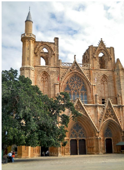
Lala Mustafa Pasha Moschee in Famagusta, die ehemalige Nikolaus-Kathedrale.