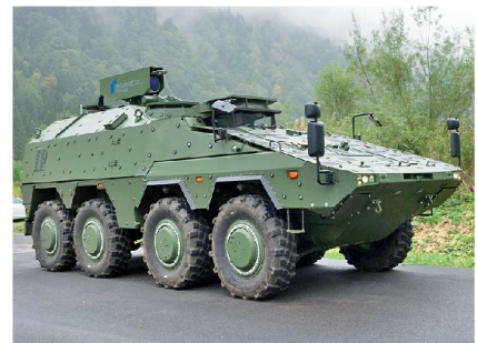
HEL 8 x 8 Radpanzer Boxer.

Die Fähigkeit einer Laserkanone, fast unbegrenzt zu verschwindend kleinen Kosten Ziele zu bekämpfen, ist die optimale Antwort auf Sättigungsangriffe mit billigen Massensystemen. Die Fähigkeit der lautlosen Bekämpfung macht den Einsatz im überbauten Gelände in Friedens-