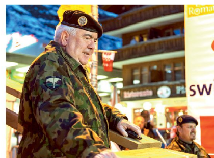
Ein sichtlich zufriedener Kdt Heer!

Teilnehmerrekord (wobei weitere 500 Patrouillen nicht berücksichtigt werden konnten). Davon waren 887 auf der Strecke von Zermatt nach Verbier und 885 auf der kurzen Strecke von Arolla nach Verbier gemeldet. Auch bei ausländischen Militärs ist die PdG sehr beliebt. Während die Schweizer mit 84 Prozent immer noch einen Grossteil der Startenden ausmachten, sind dennoch 29 verschiedene Nationen im Teilnehmerfeld vertreten gewesen, darunter sogar Nationen wie Südafrika, Singapur und die Vereinigten Arabischen Emirate sowie Beobachter aus China. Der Frauenanteil lag bei gut 13 Prozent.