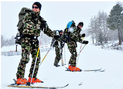
Harte Vorbereitungsarbeit vor den Rennen.

fordert. So musste am Start und im Ziel die Logistik funktionieren, die Materialkontrolle durchgeführt und die Verpflegung organisiert werden. Flexibilität war während dieser Tage Pflicht. So wurden die Starts beider Läufe wegen grossem Schneefall aus Sicherheitsgründen um jeweils 24 Stunden verschoben. Nebst freiwillig Dienstleistenden waren auch diverse Milizverbände beteiligt. Insgesamt standen 1500 Armeeingehörige im Einsatz, welche zusammen zwischen 8000 bis 10000 Dienstage verbuchten, unter ihnen auch diverse Spezialisten. So konnten die Organisatoren, das erste Mal kommandiert von Oberst Max Contesse, auf 40 Ärzte und 40 Köche zurückgreifen. Letztere bereiteten 75 000 Mahlzeiten zu. Für die Sicherheit standen drei Meteorologen und 16 Lawinenhunde sowie sechs Lawinenspezialisten im Einsatz. Damit die Spezialisten und Helfer jedoch effizient arbeiten und beherbergt werden konnten, wurden rund 210 Tonnen Material in 50