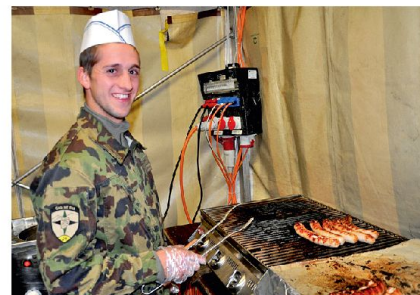
Auch am Grill bewiesen die Soldaten ihr Geschick!