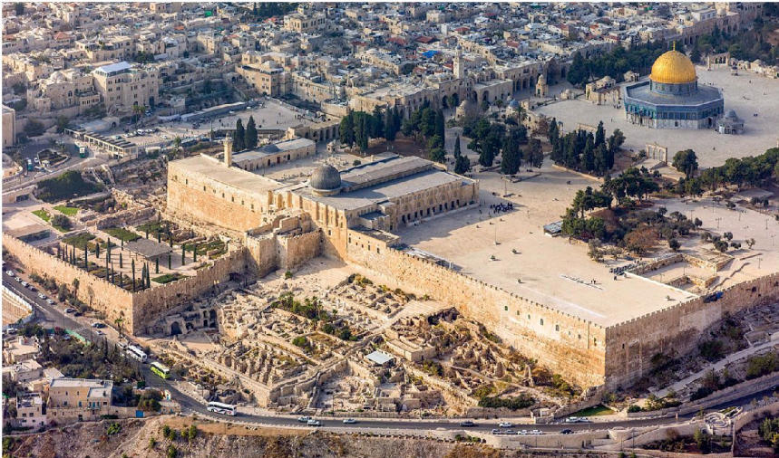
Juden, Christen und Muslime beanspruchen Jerusalem als ihr Zentrum.

lus 7 zieht eine Grenzlinie und erschlägt den Bruder, weil dieser sie nicht respektiert. Ohne die Anerkennung einer Grenze kann es keinen Staat geben. Diese intransigente Denkart ist dem Islam fremd. Brücken sind bei uns von alters her sakrosankt. Warum? Weil sie Grenzen aufzeigen. Darum konnte ihr Bau nur unter ritueller Kontrolle des Pontifex erfolgen 8 . Die Ideologie der damaligen «pax romana» (der Friede Roms) und der heutigen «pax americana», wie auch der geniale politische Entwurf des Augustus 9 beruhen auf der Präzisierung von Grenzen: die Kraft des Imperiums beruht im Wissen, auf welcher Grenze die Verteidigung zu erfolgen hat. Sobald keine klaren Begriffe von Grenzen mehr definiert sind und «Nomaden», die ihre Ursprungsgebiete verlassen haben und sich auf fremdem Territorium bewegen, als ob es das ihre wäre, haben (National-) Staaten ausgedient.