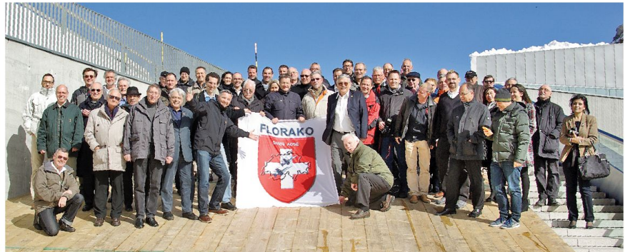
Jubiläum zehn Jahre FLORAKO vom 16. März 2014, ehemalige und aktive FLORAKO Mitarbeiterinnen und Mitarbeiter.

Vor genau zehn Jahren wurde das neue FLORAKO von der Luftwaffe in Betrieb genommen. Die offizielle Übergabe an die Benutzer fand am 17. März 2004 statt. Das äusserst komplexe FLORAKO System wurde während acht Jahren evaluiert. Die Arbeiten begannen 1992 und erreichten im Jahr 1998 die Beschaffungsreife. 1998, 1999 und 2004 wurden die Beschaffungsbotschaften den eidgenössischen Räten vorgelegt. Dazu gehörten speziell für die Schweiz entwickelte detaillierte Spezifikationen. Die Projektleitung unter der Führung der armasuisse setzte sich weiter aus Vertretern der Luftwaffe, des Planungsstabes, der RUAG, der Skyguide und weiteren Bundesstellen zusammen. Nach den Kreditbewilligungen wurde das System entsprechend den durch unsere Fachleute ausgearbeiteten Spezifikationen für unser Land gebaut. Damit verfügte die Schweiz bei der Inbetriebnahme über das wirklich modernste System. Zusammen mit den notwendigen Bauten umfasste das Budget etwa 1 Mia CHF. Beteiligte Fir-