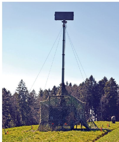
Alarmsystem ALERT: im 24 Stunden Einsatz; frühe und genaue Erkennung.

Das generelle WK-Ziel einer Flab Abt ist die Erreichung/Erhaltung der Grundbereitschaft (Fit for Mission) auf Stufe Einheit und Truppenkörper. Die Über-