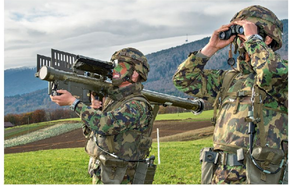
Feuerinheit STINGER: höchste Mobilität und immer das Ziel vor Augen.

eingesetzt. Im Luftraum ist die Luftwaffe mit ihren Kampfflugzeugen und Fliegerabwehrmitteln für alle Lagen zuständig. Dabei nimmt die Fliegerabwehr für den Schutz ziviler und militärischer Objekte (inklusive dem Schutz von Formationen)