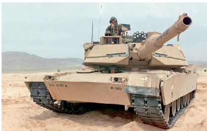
Abb. 2 (oben): Panzer 87 Leo WE. Abb. 3: Panzer Abrams M1A2SEP.

Ob die Fähigkeiten dieser Version «A4 plus» in einem konventionellen Verteidigungsfall effektiv wären, ist zumindest zweifelhaft. Weltweit verfügen viele Armeen über technologisch hochentwickelte Panzer, die gegenüber der Version «A4 plus» deutlich kampfwertgesteigert sind. Exemplarisch seien das derzeit eingesetzte deutsche (Leo II A5 und A6), französische (Leclerc Serie 3), amerikanische (Abrams M1A2 SEP, Abb. 3) und russische (T-90SM) Material genannt. Ein Vorteil des Pz 87 Leo WE ist sein relativ geringes Gewicht, da bereits die Version A6M über 60 Tonnen wiegt.