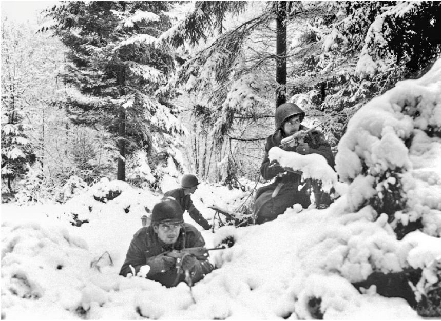
US-Infanteristen des 290th Regiment im Waldkampf in der Nähe von Amonines.

durchbrechen. Sie sprengen ein Munitionslager, leiten US-Truppen um und stiften Unruhe. Einzelne Greif-Soldaten in US-Uniformen werden gefangen genommen und standrechtlich erschossen. Am 28. Dezember 1944 ziehen sich die restlichen Verbände der Pz Br 150 von der Front zurück. Sie werden am 23. Januar 1945 aufgelöst.