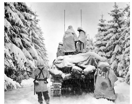
US Panzer und Infanterie auf dem Marsch.

Damit Luftlandtruppen kurzfristige Aufträge ausführen können, müssen sie entsprechend vorgängig ausgebildet und ausgerüstet sein. Beide Voraussetzungen waren für von der Heydte nicht gegeben.