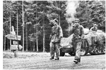
Kampfgruppe Peiper auf dem Vormarsch Richtung Malmedy.