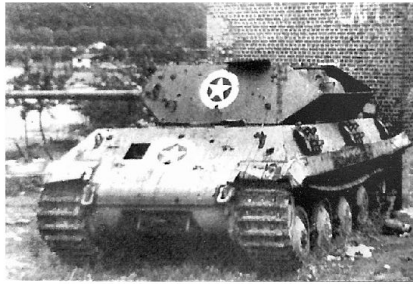
Optisch veränderter deutscher Panzer Panther.

Skorzeny erfährt am 21. Oktober 1944 von den Plänen für das Unternehmen Greif. Der Führer versprach Skorzeny 2000 Düsenjäger für die Luftüberlegenheit während der Offensive! Am 25. Oktober 1944 beginnt die Rekrutierung von englisch sprechenden Wehrmachtssoldaten. Am 2. November 1944 startet die Requirierung von erbeutetem US-Material und bis am 25. November 1944 soll die Planung beendet sein. Am 10. Dezember 1944 informiert Skorzeny seine Kommandanten über die Details und am 13. Dezember 1944 verschiebt die nicht vollständig mit dem versprochenen US-Material ausgerüstete Pz Br 150 in die Ausgangsstellung. Um die geringe Zahl der Original US-Panzer zu verschleiern, werden Panther-Panzer optisch verändert, um