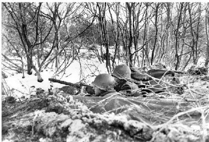
Sperre der 45. US Division.

gungen bei Nacht; zahlreiche Fallschirmjäger hatten keine operationelle Sprungerfahrung.