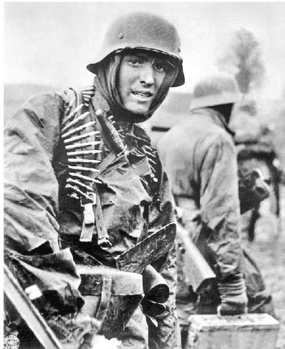
Deutscher Soldat während der Ardennenoffensive.

sie als Sherman-Panzer erscheinen zu lassen. Weiter haben alle Fahrzeuge aufgemalte US-Sterne.