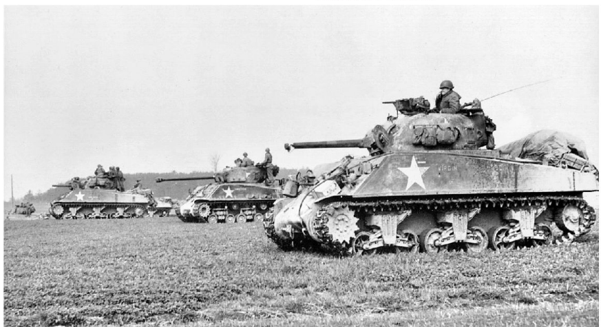
US Sherman Panzer wie sie in Europa eingesetzt wurden.

Zeitgleich mit dem Beginn der Offensive am 16. Dezember 1944 um 05.30 Uhr beginnt auch das Unternehmen Greif. Die US-Truppen werden völlig überrascht, doch es gelingt den Einheiten der Pz Br 150 nicht, hinter die feindlichen Linien zu gelangen. Deshalb wird der Angriff zuerst um einen Tag verschoben, später ganz abgesagt. Skorzenys Truppen erhalten daraufhin andere Befehle. So gelingt es einzelnen Teams in US-Jeeps die Front zu