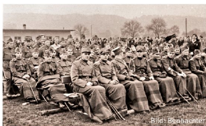
Fahnenabgabe im Winter 40/41.

Der Bataillonsarzt wurde alarmiert. Die schweren Fälle wurden in die Spitäler Olten, Niederbipp und Balsthal eingeliefert. Die Ursachen der Erkrankung waren erst unklar, auch ein Sabotageakt wurde in der angespannten Kriegsatmosphäre nicht