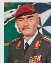
General Hans-Lothar Domröse, AJFC Brunsum