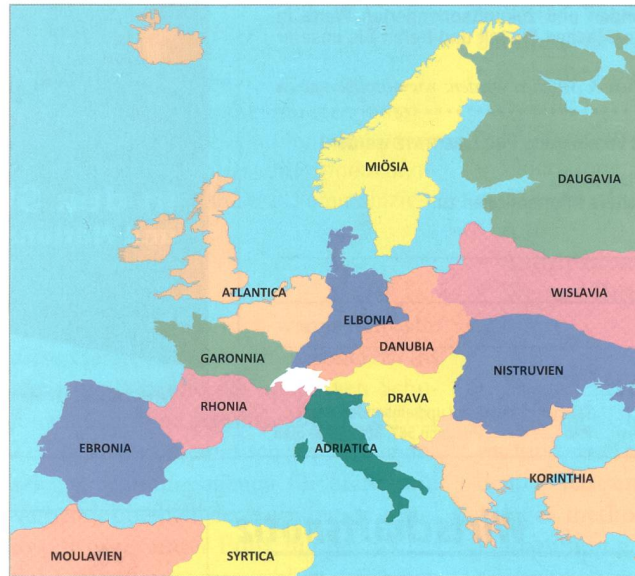
Szenarisches Standardmodell: Europäisches Umfeld (Verfremdung).

Man muss davon ausgehen, dass es in allen Phasen zum Einsatz fast aller Partner des Sicherheitsverbundes kommt; nur die jeweilige Ausprägung kann variieren. Die Armee wird sicher von Anfang an beteiligt sein: subsidiäre Schutz- und Sicherungseinsätze, territorialdienstliche Aufgaben, Wahrung der Lufthoheit bzw. Luftpolizeidienst usw. Die Phase zwei dürfte von der Koordination her die schwierigste sein, da sich die Grenzen zwischen Unterstützung und Verteidigung vermischen, ja die eigenen rechtlichen «Fussangeln» vom Gegner gezielt ausgenutzt werden. In dieser Phase werden auch umfangreiche zusätzliche Kräfte der Armee mobilisiert. In der Phase drei schliesslich ist die Armee gezwungen, eine entscheidende Operation gegen ausgedehnte militärische Kräfte zu führen.