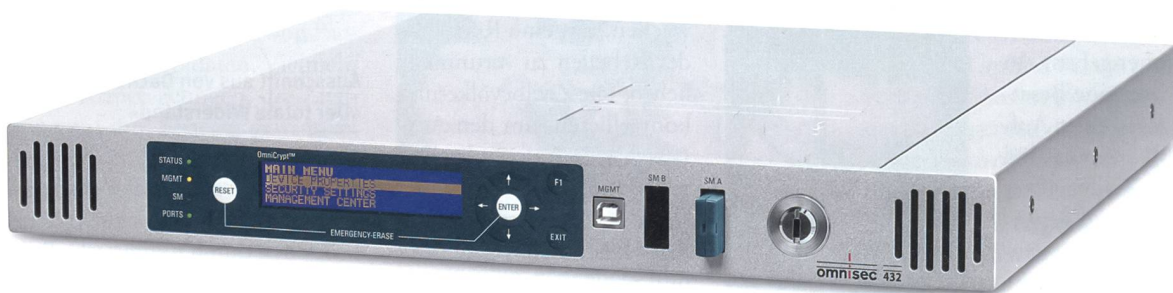
OmniCrypt™ VPN Encryptor 432