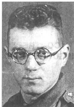
Oberstlt David Galula,

Die konkrete Umsetzung im Irak wurde von Petraeus «Anaconda Strategy» getauft. Das Zusammenwirken zwischen Interagency (Zusammenarbeit aller betei-