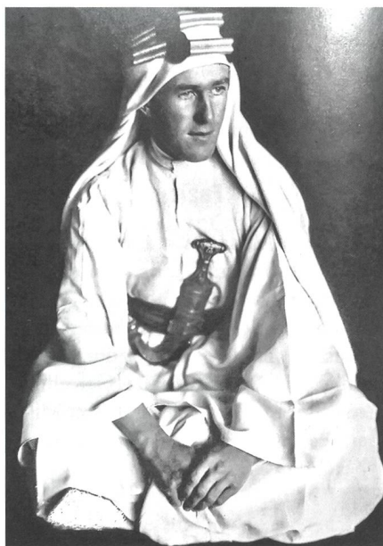
Lawrence von Arabien, 1888–1935.

Arabia»), der von den Briten im ersten Weltkrieg als Verbindungsoffizier zum Emir von Mekka eingesetzt wurde. Er versuchte, die arabischen Stämme zu einigen und führte ihren Aufstand gegen die Osmanen an. Sein Rezept für einen erfolgreichen Aufstand bestand darin, dass eine