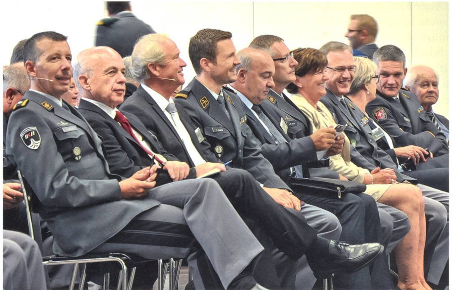
Neben Bundesrat und hohen Militärs sassen auch die Teilnehmer des zweiten Podiums in der ersten Reihe (Erste Reihe Politiker Podium).