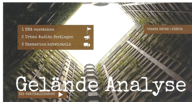
Dem wahren Gesicht des Geländes Herr werden.

Der Blick auf ein modernes urbanes Gelände erfordert eine neue Perspektive und eine spezifischere Analyse als der Blick auf