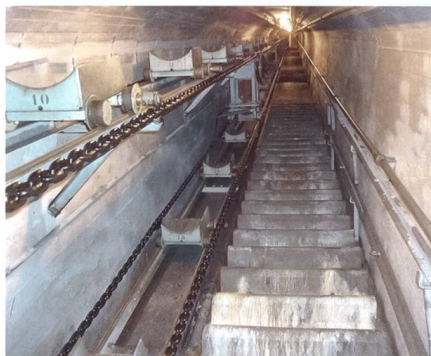
Festung Furggels (schussbereit 1940): Treppe zu einem 10,5-cm-Panzertrum mit Paternoster-Munitionsaufzug.

Viele Kritiker, besonders die Armeeabschaffer, behaupten, der General habe kaltblütig das Volk im Mittelland preisgegeben. Das Gegenteil stimmt. Wäre die Armee im Mittelland geblieben, so hätte sie