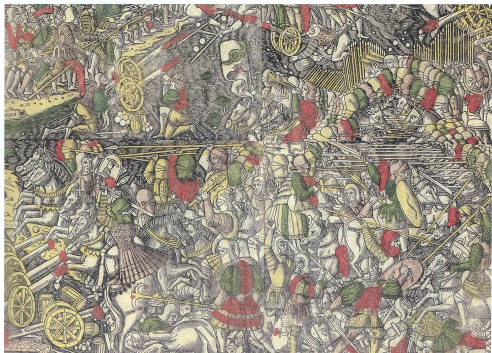
Abb. 3: Schlacht bei Marignano.

Dann sieht Theseus den klugen und wunderschönen Ochsen. Er ist behängt mit vielen Katzen, den Volksverführern, welche selbstsüchtig in verschiedene Richtungen ziehen. Es sind jetzt alle Mächte vertreten und nicht nur Frankreich. Sogleich folgt das Bild des Bären, das als Bern gedeutet werden darf. Das wilde Tier ist mit einem Nasenring gezähmt, was die starke französische Partei in der Aarestadt symbolisiert und auf die Annahme des Vertrags von Gallerate und die Heimkehr vor der Schlacht hindeutet. Schliesslich wird das «vich» des Minotaurus im Kampf besiegt.