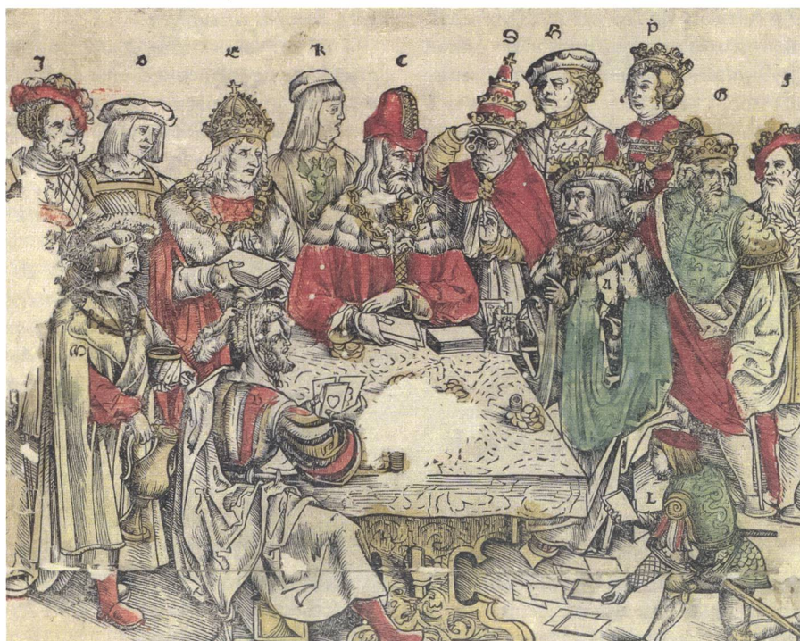
Abb. 1: Gedicht Zwinglis «welscher Fluss». Bilder: ZB, Graphische Sammlung

Die Tiere sind stellvertretend für die politischen Akteure der Zeit ausgewählt. Der schlichte, starke Ochse steht für die Eidgenossenschaft. Hier übernimmt Zwingli das Urner Wappentier. Er wohnt wohl geschützt durch Berge in einem idyllischen Garten mit rauschenden Wasserquellen und saftigem Gras. Er hat alles, um glücklich und frei zu leben. Leider wird er bedrängt durch ihn umschmeichelnde Katzen. Es sind die Werber des listigen französischen Leoparden. Gleichzeitig warnen sie ihn vor der Habgier des Löwen (Habsburg). Das hält Frankreich nicht ab, gemeinsam mit diesem (Liga von Cambrai) das venezianische Füchlein übel zuzurichten. Der treue Hund (der «Pfaff») des päpstlichen Hirten, mahnt den Ochsen ständig zur Vorsicht. Das tut der Hirte aber nicht uneigennützig, denn er will angeblich seinen Lämmlein helfen. Dazu braucht er die