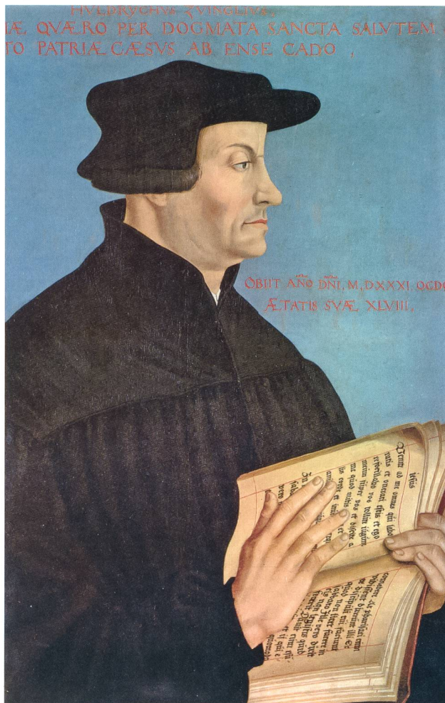
Abb. 4: Ulrich Zwingli.

Es wäre aufgrund des Gezeigten falsch, das Marignano-trauma des Reformators Zwingli als einziger Grund der Gegnerschaft zum Reiselauf und zur Abkehr vom Papsttum zu sehen. Unsere vier Quellen, zwei vor und zwei nach der Schlacht, haben jedoch gezeigt, dass mit dem September 1515 eine wichtige Wende eingetreten ist. Die Schlacht wirkte als Katalysator, der den Prozess hin zur Reformation und zur Neutralität – noch nicht im modernen Sinn – beschleunigte. Das ist der Kern des heute vom Mainstream der Historiker bestrittenen «Marignano-Mythos». Die Schlacht war der Kristallisationspunkt für eine Neuorientierung der Eidgenossenschaft. So betrachtet, trifft der Spruch auf dem Gedenkstein in Melegnano «ex clade salus» das Wesentliche. ■