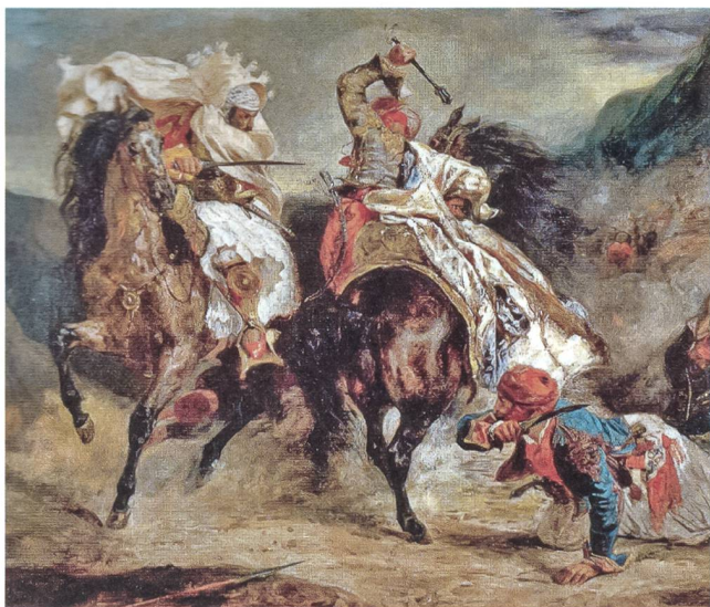
Verbreitung des Islams mit dem Schwert. GeoEpoche, Nr. 75, p. 67

Die dritte islamische Expansion findet in unseren Tagen einerseits in Form von friedlicher Zuwanderung in wohlhabende Industriestaaten, andererseits durch den kriegerischen Dschihad statt, wie wir ihn schon aus der ersten und zweiten Expansion kennen.