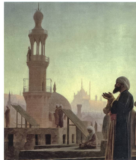
Aus Kirchen und Synagogen wurden Moscheen.

der Schweiz sein. Kein anderes Land gewährt ihren Bewohnern so viele Freiheiten und ist so zurückhaltend in ihrer Überwachung. Die Schweiz ist deshalb zu