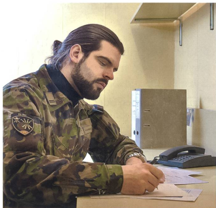
Ein Sprachspezialist-Offizier analysiert im Führungsraum der Einsatzzentrale Aussagen aus Befragungsprotokollen einer Übung und beurteilt die Glaubhaftigkeit der Aussagen.

des ihrer Einsatzsprache ist für Ssp Of eine wichtige Voraussetzung, um im Einsatz bei Personenbefragungen erfolgreich zu sein. Der grosse Teil der Ssp Of verfügt über eine Hochschulausbildung und nimmt in der Privatwirtschaft anspruchsvolle Führungsfunktionen wahr.