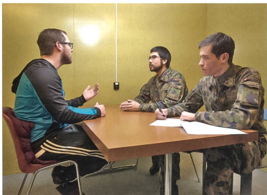
Zwei Sprachspezialisten-Offiziere der Ssp Kp 41/2 trainieren mit einem Kameraden in zivil eine Befragung.

Uni St. Gallen und Leiterin des Kompetenzzentrum für Rechtspsychologie, sagte diesbezüglich vor Monaten gegenüber dem Schweizer Fernsehen SRF, dass man