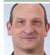
Brigadier Marco Schmidlin Kdt FU Br 41/SKS FU Br 41/SKS 8180 Bülach

Die Schweizer Armee verfügt mit den Ssp Of über eine spezielle Ressource, die sie bei Bedarf zum Schutz der eigenen Truppen und der Bevölkerung einsetzen kann. ■