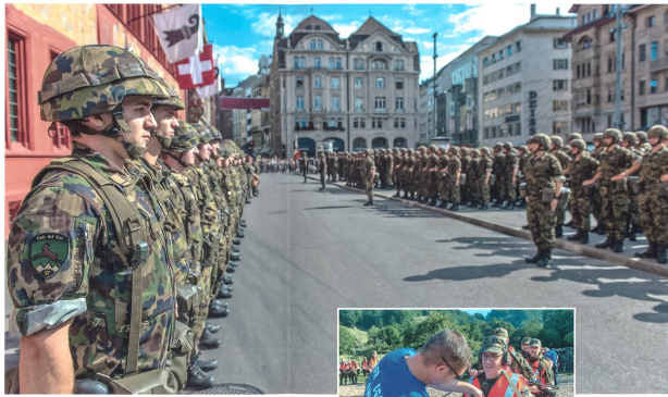
Abb. 2: Aus Blogs wusste man, was an Störaktionen geplant war. Ein Dispositiv der Kantonspolizei ermöglichte den reibungslosen Ablauf der Fahnenrückgabe auf dem Basler Marktplatz.

Für die Truppe wurden allein während der Übung vier Ausgaben der Truppenzeitung «sGemsch» produziert, die mittels Fotos, Interviews und Berichten Hintergründe zum Bataillon, zum GWK und zur Ter Reg 2 lieferten. Dies wurde von den Soldaten sehr geschätzt.