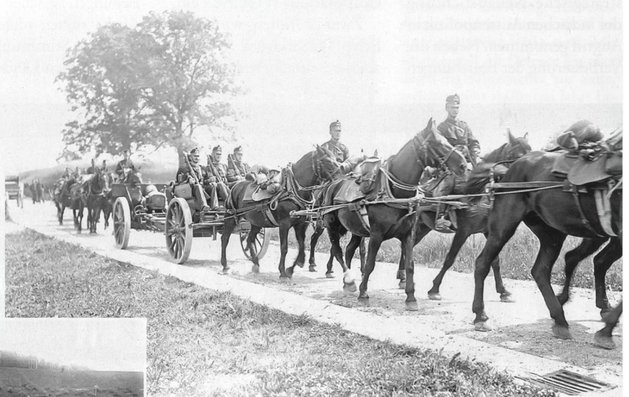
Artillerie-Einheit bei Bülach ZH.