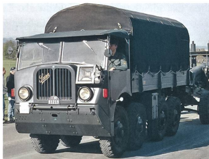
Die Nachfolger: Saurer M8 mit 15 cm schwere Haubitze.

Die durch die Truppenordnung von 1946 vorgesehene einschneidende Verminderung des Pferdebestandes der Armee stiess auf grossen Widerstand, insbesondere bei Artilleristen. Eine Petition bedeutender Verbände und Vereine in der Schweiz, darunter auch des Verbandes der Schweizer Artillerievereine, wurde von rund 158 000 Personen unterschrieben. Es erwuchs Maurer grosse Opposition aus den eigenen Reihen. Seine Erklärungen für eine möglichst durchgehende Motorisierung der Artillerie setz-