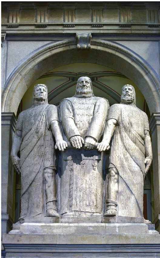
Drei Eidgenossen (Skulptur James Vibert im Bundeshaus).

Mit diesen Fragezeichen ist indirekt ein Weg aufgezeigt, wie das Verständnis und die Verankerung der Sicherheitspolitik in der Öffentlichkeit vertieft werden könnten. Ohne Anstrengungen geht es allerdings nicht. Denn die Sicherheitspolitik berührt die heiklen Dimensionen klarsichtiger Analysen der Verletzlichkei-