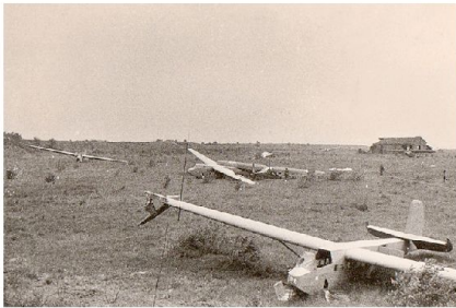
Landung der Lastensegler auf der Festung.