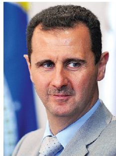
Der syrische Präsident Baschar al-Assad.

Wenn die Allianz verhindern will, dass der Irak zerfällt und dass der IS dazu übergeht, auch in den Herkunftsländern ihrer Kämpfer weitere Terroranschläge zu verüben, darf keine Zeit mehr verloren werden. Die aktuellen Entwicklungen in Libyen lassen befürchten, dass es mittlerweile nur noch 1 Minute vor 12 ist oder bereits danach! ■