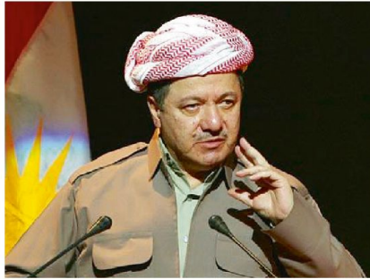
Massoud Barzani, Präsident der autonomen Region Kurdistan.

der irakischen Armee im Kampf mit dem IS und sind dabei derartig erfolglos, dass nicht nur der internationale Flughafen unter die Kontrolle des IS geraten könnte, sondern sogar ein Vordringen in die Hauptstadt noch immer nicht auszuschliessen ist. Neben den irakischen Kämpfern, die das Land am Boden gegen den IS vertei-