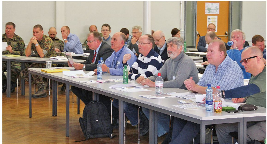
Teilnehmer der Tagung.

Um den Interessenraum, bestehend aus Luft-, Gewässer- und Landgebieten, analysieren zu können, braucht es entsprechende Geoinformationen. Diese Informationen, unter anderem Landeskarten, Luftfahrtkarten, Luft- und Satellitenbilder, Landschafts- und Höhenmodelle oder auch thematische Karten, werden für den Bereich Verteidigung hauptsächlich