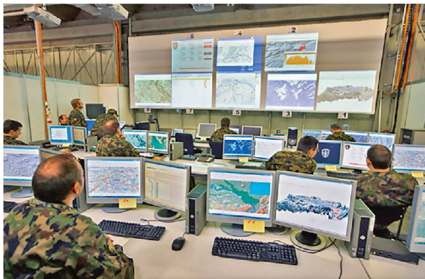
Geodaten werden in der Einsatzführung rege genutzt.