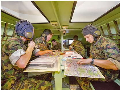
AdA beim Lesen von Karten (ELTAM).

rien den Ausbildungsstand der Schweizer Offiziere im Bereich Geoinformationen im multinationalen Umfeld. Er erwähnte ausserdem, dass es nicht einfach war, die grenzüberschreitenden Bedürfnisse an Geodaten abzudecken, da einige Länder ihre Daten nicht zur Verfügung gestellt hätten.