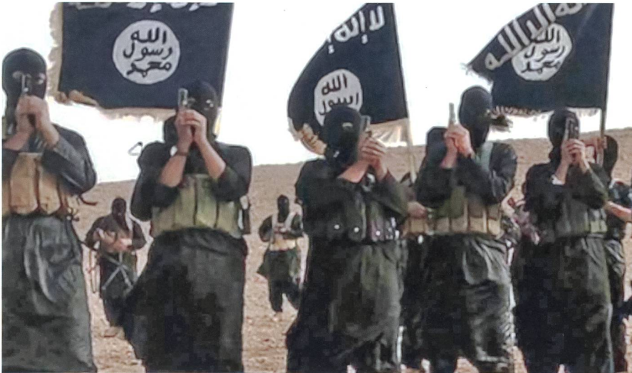
IS-Terroristen in Ramadi.