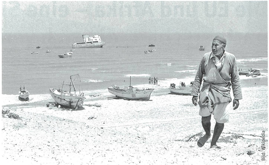
Der Hafen von Gaza im Jahr 1980.

Seit diesen bürgerkriegsähnlichen Gefechten zwischen Milizen der beiden verfeindeten palästinensischen Bewegungen stellt die HAMAS die Regierung im Ga-