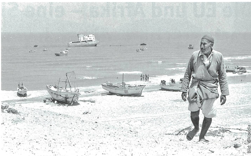
Der Hafen von Gaza im Jahr 1980.

Seit diesen bürgerkriegsähnlichen Gefechten zwischen Milizen der beiden verfeindeten palästinensischen Bewegungen stellt die HAMAS die Regierung im Ga-