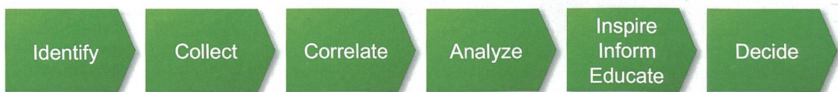
Abb. 1: Schematisches Verfahren zur Technologiefrüherkennung.

1. Entwicklung einer Methodologie (Abbildung 1) zur Identifizierung und Analyse disruptiver Technologien. Entscheidend sind in diesem Zusammenhang zudem die Wahl der Informationsquelle (Patente, wissenschaftliche Veröffentlichungen, spezifische Internetseiten etc.) sowie die Schaffung eines Informationsnetzes.