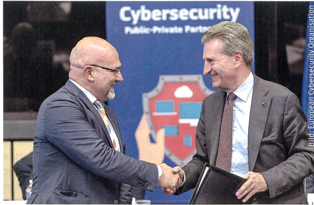
Handshake zwischen ECSO und EU.

Die Europäische Union wird im Rahmen ihres Forschungs- und Innovationsprogramms Horizon 2020 ca. 450 Mio. Euro für Cybersecurity einsetzen. Ein Aktionsplan, der die Zusammenarbeit von privaten und öffentlichen Institutionen fördert, generiert ein erwartetes Wirtschaftsvolumen von bis zu 1,8 Mia. Euro. Davon geht zumindest die EU-Kommission aus. Sie ist es auch, welche mit dem Branchenverband ECSO – European Cyber Security Organisation – die weiteren Schritte koordiniert. Eine Studie zeigte nämlich, dass mindestens 80% der europäischen Unternehmen im letzten Jahr einen Cybersecurity-Zwischenfall verzeichnen