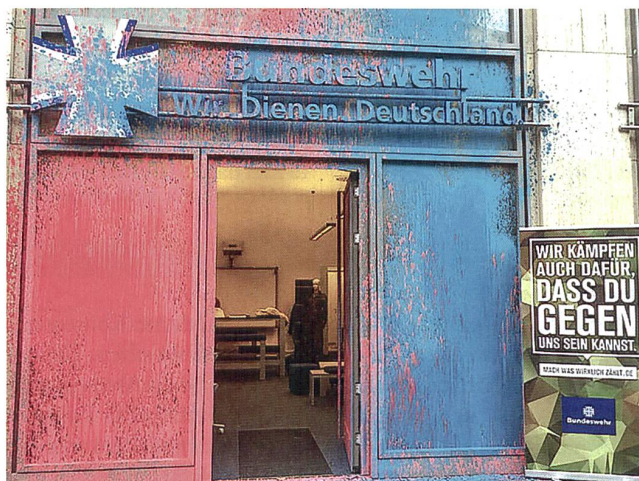
Kampf an allen Fronten.

Andere Waffengattungen haben ähnliche Probleme: bei der Luftwaffe zeigt das A400M-Debakel Wirkung. Von offizieller Seite wurde bekannt gemacht, dass sich demnächst zwei Fähigkeitslücken eröffnen. Erstens kann nicht mehr soviel wie gefordert transportiert werden und zweitens stehen keine geeigneten Mittel für kritische Missionen (in Kriegsgebiete, für Evakuationen, usw.) zur Verfügung. Deshalb plant die Luftwaffe nun gemeinsam mit Frankreich, allenfalls auch England, altgediente Maschinen des Typs HERKULES C-130 zu beschaffen. Da dieser Typ weder in die Weissbuchstrategie noch in das aktuelle Beschaffungskonzept passt, nimmt das Verteidigungsministerium derzeit noch keine Stellung.