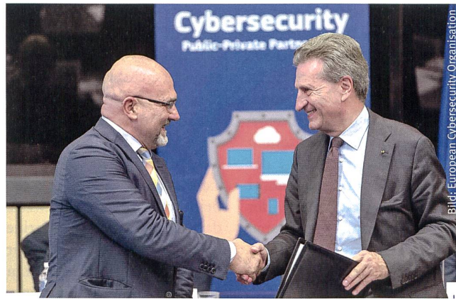
Handshake zwischen ECSO und EU.

Die Europäische Union wird im Rahmen ihres Forschungs- und Innovationsprogramms Horizont 2020 ca. 450 Mio. Euro für Cybersecurity einsetzen. Ein Aktionsplan, der die Zusammenarbeit von privaten und öffentlichen Institutionen fördert, generiert ein erwartetes Wirtschaftsvolumen von bis zu 1,8 Mia. Euro. Davon geht zumindest die EU-Kommission aus. Sie ist es auch, welche mit dem Branchenverband ECSO – European Cyber Security Organisation – die weiteren Schritte koordiniert. Eine Studie zeigte nämlich, dass mindestens 80% der europäischen Unternehmen im letzten Jahr einen Cybersecurity-Zwischenfall verzeichnen