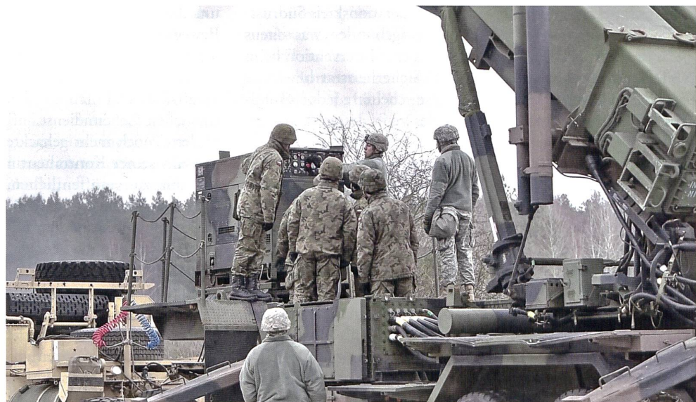
PATRIOT in Sochachew, Polen.

nicht vor 2022 liefern wird. In der Zwischenzeit wird sich Polen deshalb auf das AEGIS Ashore Raketenabwehrsystem verlassen, welches unter US-Schirmherrschaft ganz im Norden des Landes ab 2018 seinen Betrieb zugunsten des NATO-Raketenschutzschildes aufnimmt.