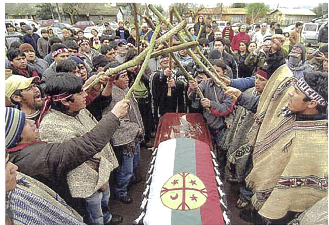
Beisetzung des von der Polizei von hinten erschossenen Mapuche.