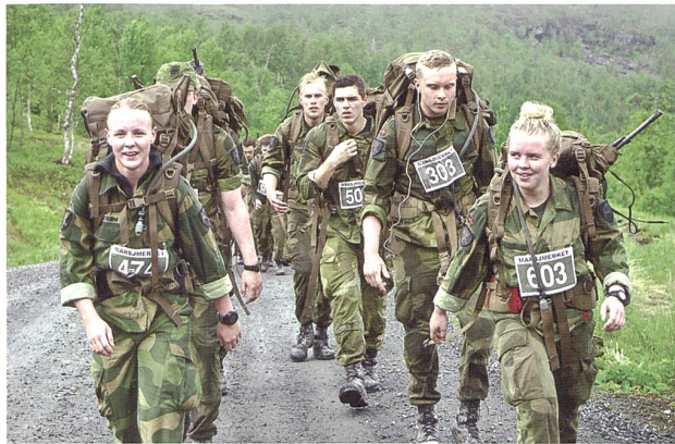
«Auf, auf, marsch, marsch.» Ein 30-km-Marsch (ohne Schiessen) mit Rucksack und Sturmgewehr (zusammen 11 kg) um das renommierte «March Merit Badge».