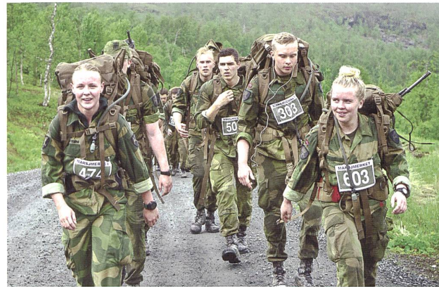
«Auf, auf, marsch, marsch.» Ein 30-km-Marsch (ohne Schiessen) mit Rucksack und Sturmgewehr (zusammen 11 kg) um das renommierte «March Merit Badge».

* Der «Beret-Lauf 2015» der Lehrgangsteilnehmer an der norwegischen Heeresoffizierschule fand vom 10.–11. September im Militärlager Rena statt. Die Teilnehmer mussten mit guten Ergebnissen ans Ziel kommen, nicht nur, um sich das Barett des Heeres zu verdienen, sondern auch, um ihre Persönlichkeit zu formen und Selbstwertgefühl und Zuversicht zu steigern. Dazu wurden sie mit mehreren Einlagen an ihre physischen und psychischen Grenzen gebracht. Der Lauf wurde offiziell mit einer Parade beendet, in welcher der Kommandeur der Heeresoffizierschule, Oberstleutnant Atle Molde, das Treuegelöbnis des norwegischen Heeres für die Lehrgangsteilnehmer ablegte.