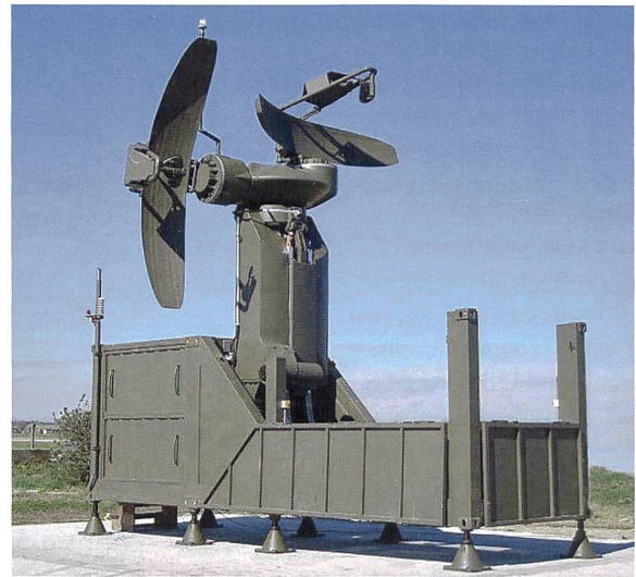
Betrieb und Unterhalt von MALS.

Durch ihre vielschichtigen Dienstleistungen und Aktivitäten trägt FUFU wesentlich dazu bei, dass die FUB in der Lage ist, die IKT-Leistungen zugunsten