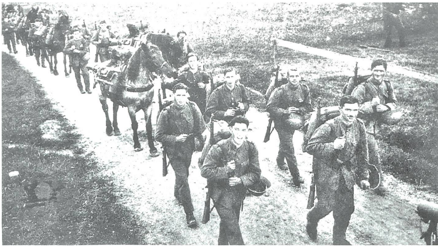
Mitrailleuzug der Gebirgs-Füsilier-Kompanie IV/90.

züglichen Ruf. Die ausserordentliche Persönlichkeit, Bedeutung und Nachhaltigkeit dieses ersten legendären Kommandanten für das Füs Bat 90 und für Solothurn belegt die Tatsache, dass die heutige und für den Kanton bedeutende Zentralbibliothek in Solothurn das Ergebnis einer Schenkung von Emil Zetter ist.