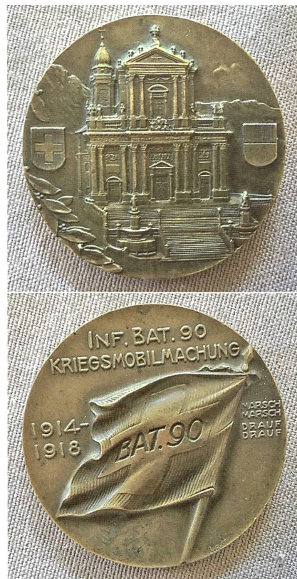
Medaille zum Aktivdienst 1914–1918, gestiftet von Major Zetter.

man sich im harten und für Unterländer ungewohnten Gebirgsdienst. Ohne Zusammenhalt konnte man bekanntlich in einem Gebirgs-WK keine guten Resultate erreichen.