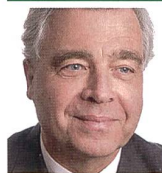
Oberst aD Erwin H. Hofer 2012 bis 2014 Schweizer Botschafter in Libyen Jurist und Dozent 6010 Kriens

Libyen bräuchte heute weniger Visionen, wie dies der zuständige deutsche UNO-Beauftragte, Martin Kobler, wünscht, sondern eine starke ordnende Kraft, welche imstande wäre, in den drei unterschiedlichen Landesteilen Tripolitaniens im Westen, Kyreneika im Osten und Fezzan im Süden die notwendige, durchsetzungsfähige Unterstützung zu erhalten. ■