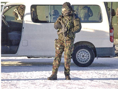
Ausbildungssequenzen AAD 10, 2007.