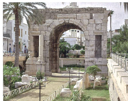
Triumphbogen Mark Aurel in Tripolis.

Nach dem nur vordergründig erfolgreichen Umsturz Gaddafis, der ohne die massive Luft- und See-Unterstützung durch die NATO rasch in sich zusammengebrochen wäre, nahmen praktisch alle westlichen Botschaften Ende 2011/anfangs 2012 ihren Betrieb in Tripolis mit einem zweifachen Ziel wieder auf – einerseits zwecks Interessenvertretung im strategisch wichtigen Libyen als Brücke zum Nahen Osten, zum Sahel und zum Mittelmeer so-