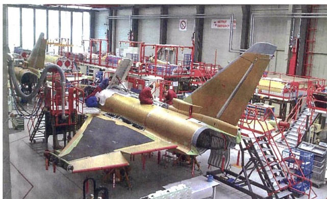
Eurofighter-Fertigung in Manching, Deutschland.

Zwanzig Jahre nach dem Erstflug des europäischen Prestige-Projekt Eurofighter TYPHOON könnte nach 2018 mit der Fertigung in Deutschland Schluss sein. Immer weniger Luftwaffen fragen den Deltaflügler nach. Zuletzt verkaufte Italien noch 28 Stück für acht Mia. Euro nach Kuwait, diese Produktion tangiert die deutschen Werke aber praktisch nicht. Das gleiche gilt laut Airbus für Spanien. Langfristig würden die Produktions-