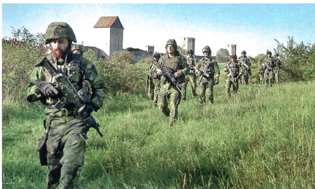
Patrouille auf Gotland.

mandeur der Garnison Gotland mitverfasste, wurde der Entscheid nun vorgezogen. Schweden glaubt tatsächlich an das Invasionszenario. Deshalb bleiben seit September 150 Soldaten der Skaraborgbrigade bis auf weiteres auf Gotland stationiert. Dass diese einem möglichen Invasor wenig entgegenbringen können, ist auch schwedischen Militärs klar. Es wird davon ausgegangen, dass Russland die Insel innert eines Tages mit ca. 3400 Soldaten auf konventionelle Art einnehmen würde. Aus diesem Grund gibt es in schwedischen Offizierskreisen auch genügend kritische Stimmen, welche die (Wieder-)Befesti-