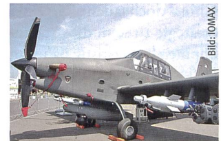
AT-802U Air Traktor ARCHANGEL an der Dubai Airshow.

gezielten, durch Drohnen-aufklärung (chinesische Wing Loong UAV) unterstützte Angriffe von Spezialflugzeugen des Typ ARCHANGEL, aber auch durch Sonderoperationskräfte und Verbündete am Boden geführt. Die ISR-fähige ARCHANGEL, für den Grenzschutz konzipiert, entwickelt sich zusehends zur Multifunktionsmaschine in der Aufstandsbekämpfung. Und so zeigt die Situation in Libyen auf eindrückliche Art und Weise zwei Dinge: Erstens, dass in einem Konflikt mit (zu) vielen verschiedenen Interessensvertretern und unklaren Allianzverhältnissen kein abseh-