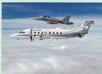
46 Abfangjäger feuert einen «Warnschuss» mit Flare ab