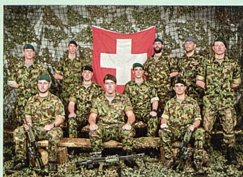
32 Das Team Swiss Armed Forces