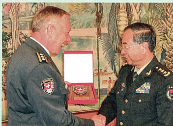
22 CdA mit General Fang Fenghui