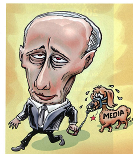
Karikatur: Umgang Putins mit den Medien. Bild: Wikipedia/von Wellemann

nahme der Friedensgespräche in Genf und damit an einer möglichen politischen Lösung des Konflikts;