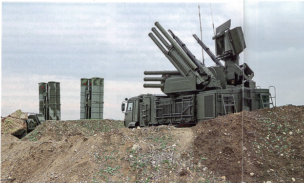
Russische Flugabwehrbatterie bei Latakia.

satz, die von Schiffen aus dem Schwarzen Meer abgefeuert wurden.