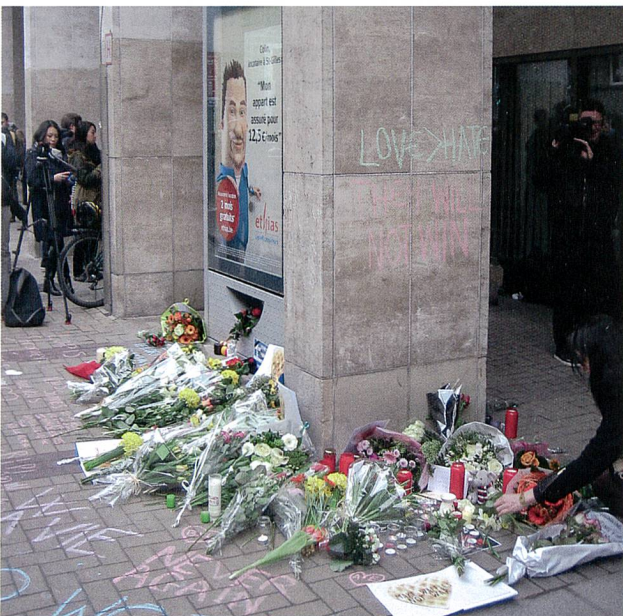
Zeichen der Trauer am Eingang der Metro-Station Maelbeek.

Der Muslim weiss um diese andere Dimension. Und sie ist es, die ihn derart erfüllt, dass er nebst unserer Technik, die er sich ja auch aneignet, mit diesem zweiten Element zweihundert Prozent aufrüstet. Sie ist eine ganze zweite Welt, sie taucht ihn ins Mystische, in eine zweite Welt des Numinosen.