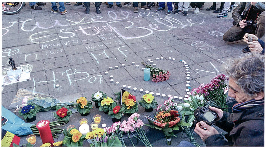
Brüssel est belle – stiller Protest gegen den Terror.

Unsere Soldaten sind mit Söldnern vergleichbar. Sie führen Krieg um Materielles, primär z. B. um Sold. Um eine gute Position. Um materielles Ansehen. Ein Händler opfert aber sein Leben nicht für Geld. Und mit einem Söldner oder einem Kommerzianten ist in diesem Sinn dann auch