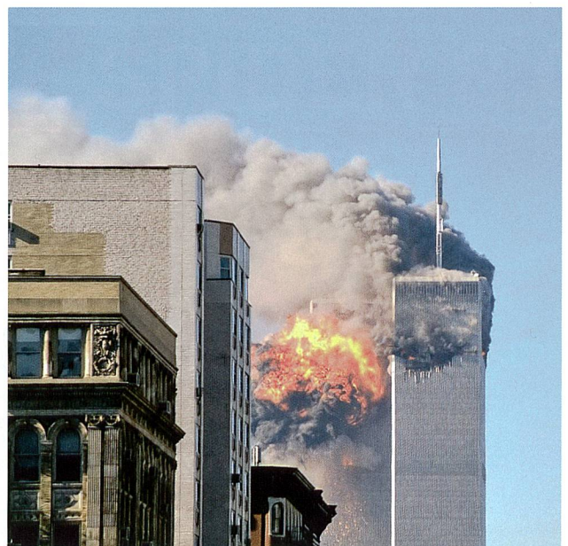
9/11 in New York als Beginn des Krieges gegen den Terror.

Die Antwort lautet, weil wir schon immer dem Phänomen Terror begegneten. Wir wollten es nur nicht mehr wahrhaben. Wir haben eine Welt geschaffen, in welcher wir alles und jedes immer mehr verbessern, vor allem auch Recht, Moral, Korrektheit, Völkerverständigung, Frieden