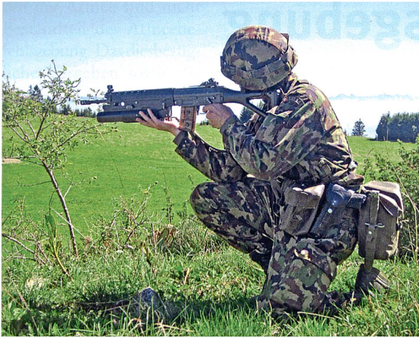
Stgw 90 mit montiertem Granatwerfer.