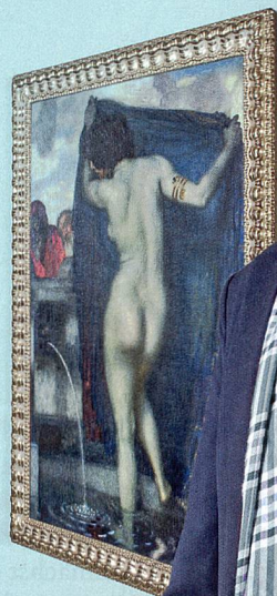
Franz von Stuck (1863 – 1928) | Susanna im Bade, 1904, Öl auf Leinwand, 134.5x98cm

Begeisterung? «Kunstliebhaber schätzen Sicherheit.»